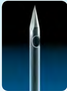
SFN®-Portkanüle SFN®-Port needle