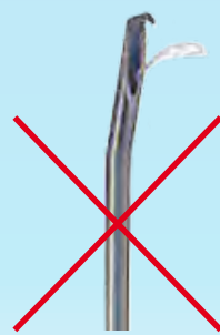
Beispiel einer Portkanüle Example of port needle