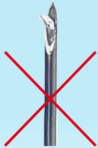
Standardkanüle Standard needle