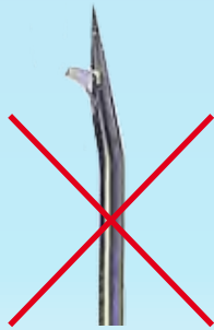
Huberkanüle Huber needle